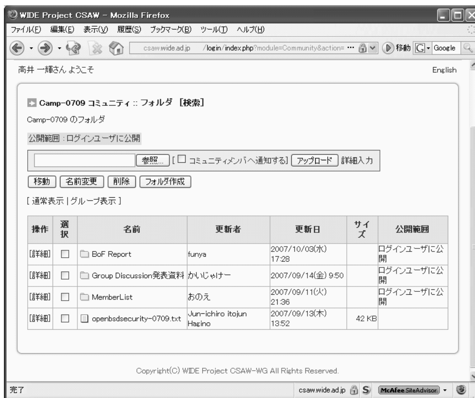
図 3.2. コミュニティフォルダ上で会議のログなどを共有