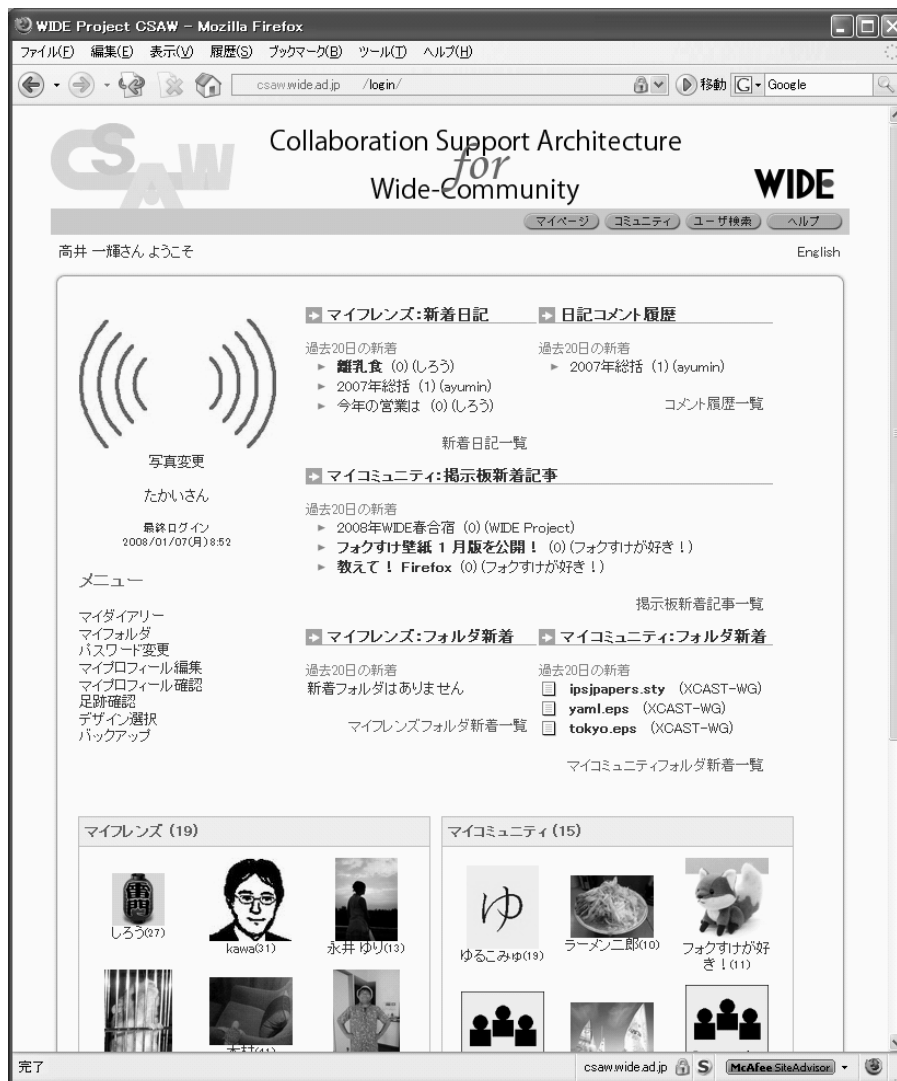
図 2.3. CSAW ログイン後の画面