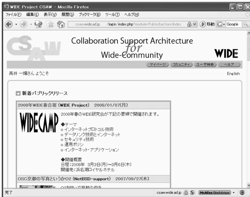
図 3.1. 一般ユーザには公開情報が見える

ない) ユーザが上記アドレスにアクセスすると、一般のユーザに対して CSAW から発信している情報を閲覧することができる(図 3.1)(ログインは必要ない)。WIDE メンバ証明書を持つユーザは上記アドレスからログインすることにより、CSAW の機能を完全に利用することができる。